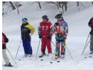
寄り添うカラフルな REON