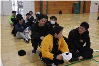
先に集まって、大樹高校生を待つ