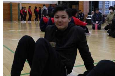
グループ顔合わせ。緊張気味?