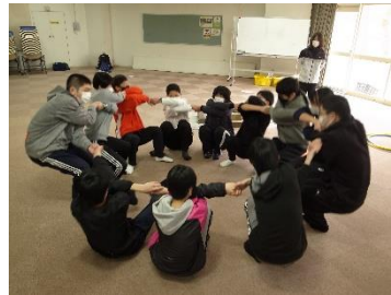
スタンドアップの様子

4月13日(火)から14日(水)にかけて、1学年で「国立日高青少年自然の家」にて宿泊研修を実施いたしました。1日目は、自然の家の方が準備してくださった「仲間作りゲーム」の時間があり、最後はクラス全体で「スタンドアップ」というゲームに取り組み、見事立ち上がることができました。午後には、「総合的な探究の時間」として、沙流川と開拓の始まりについてと、日高山脈にある石について学びました。生徒は日高の開拓に尽力した方々に対して、その熱意と行動力に感動したり、道ばたにある石について興味を抱いたりしていました。2日目には、野外炊事があり、自分たちで火起こしから始めカレーライスを作りました。火起こしはコツが必要で、苦戦しながらも最後は全ての班で美味しいカレーライスを食べることができました。