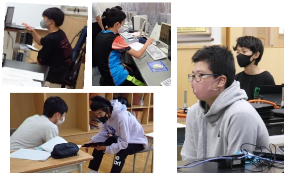
みんな真剣に活動していました