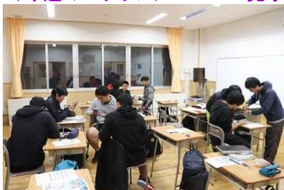
必死で夕食のお店選びを検討!

<今週のスナップ> LHR:見学旅行自主研修プラン(9/25水)、2学期期末考査の様子(9/26木)