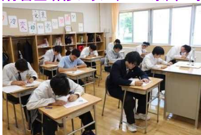
全員、「脳ミソフル回転」でテストに挑んでいました。さてさて、結果や如何に!?